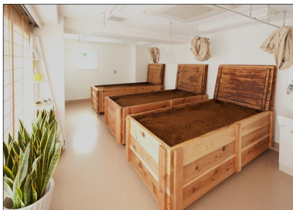
酵素風呂は合計3台