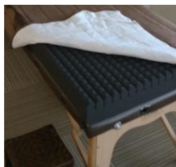
マットはスリープマジック