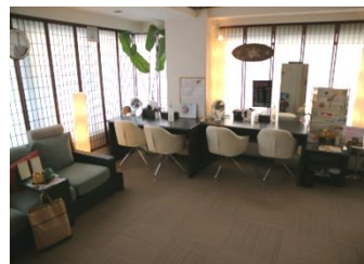
リラックスできるサロン内

毎日を頑張るすべてのライフアスリートのために健康睡眠寝具を提供するライズTOKYOより、ライズのマットが体験・購入できる東京のお店をご紹介します。今回ご紹介するのは、女性専用サロン、「酵素風呂ボラボラ」さんです。場所は東京都中央区。地下鉄日比谷線、JR京葉線の八丁堀駅から徒歩1分とアクセス良好です。