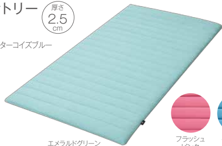
エメラルドグリーン

○アウターカバー 表面:(表側・中わた・裏側)ポリエステル100% (キルティング製品許容範囲+5%-3%) 裏面:ポリエステル100% 中袋:ポリエステル100% ○中材:ポリエチレン