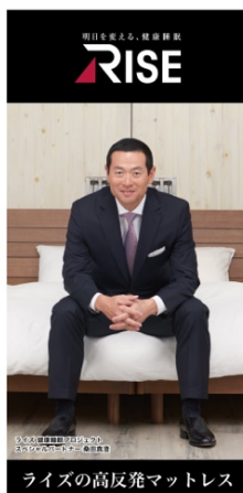
桑田真澄氏の大型バナー

また、人通りの多いメインウィンドウには、RISE健康睡眠プロジェクト スペシャルパートナー 桑田真澄氏の大型バナーをディスプレイし、RISEのブランドビジョンである「質の高い睡眠がもたらす、目覚めたときに実感する幸せ」のメッセージを伝えます。RISEは高反発マットレスを通じて、シュアステイプラスホテル by ベストウェスタン新大阪に宿泊されるスポーツ選手をはじめ、毎日を頑張るビジネスマンなどすべてのお客様の睡眠をサポートすることを目指します。