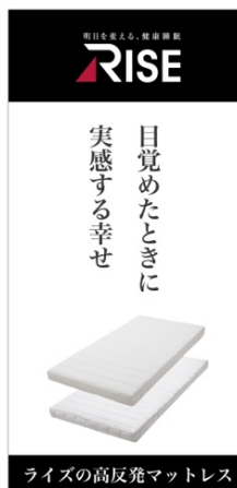
ライズの高反発マットレス