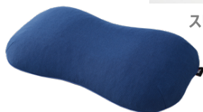
スリープオアシス 寝返りサポート枕