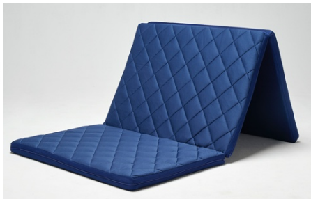
スリープオアシス アスリートモデルマットレス