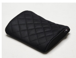
スリープオアシス 腰サポートクッション / カーシートクッション