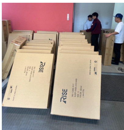
設置を手伝う学生の様子と、部屋の2段ベッドに導入されたスリープオアシス